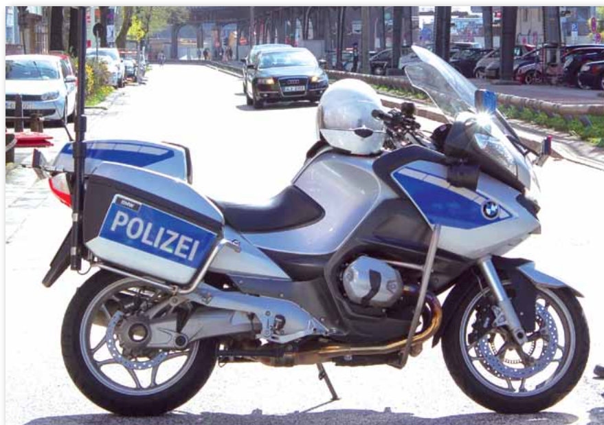
Einsatzmittel ohne Kräfte – dies ist keine Option für die Hamburger Polizei.